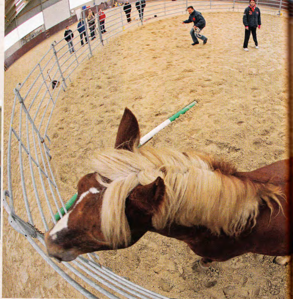
Anhalten lassen zwischen zwei Stangen: Eine gute Übung, um präziser zu werden.

sie stetig die Strategie änderte. Verdeutlichen und Dranbleiben löse das Problem, so Markus Eschbach. Sehr eindrucksvoll – daher nur wenn notwendig einzusetzen – ist das Propellerschwingen des Seils oder ein Aufklatschen lassen auf den Boden. Das Seil ist dabei nicht zum Schlagen gedacht – es ist die Verlängerung des Arms, keine Longenpeitsche, betont der Kursleiter.