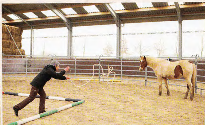
Die Klärung eines Missverständnisses in drei Schritten: „Geh voran!“ will die Kursteilnehmerin mit dem treibenden Seilwurf sagen. Das macht das Pferd, entscheidet sich aber ein paar Schritte weiter ...