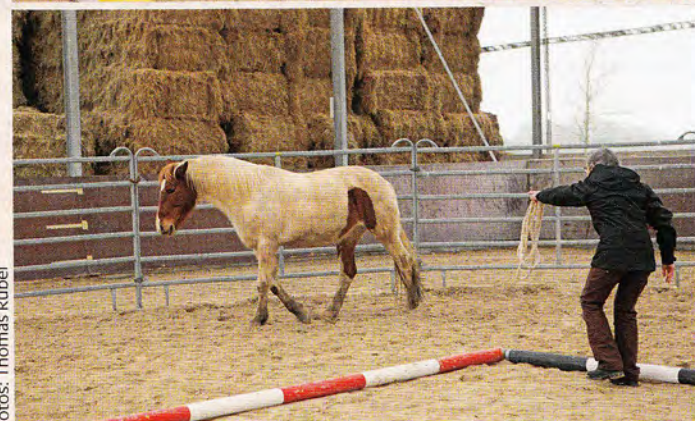
... folgt prompt: Das Pferd wendet ab und geht weiter gelassen voran. Ein kleiner Erfolg.

mit der Hand. Der Arm des Menschen, der das Seil trägt, weist ca. eine Viertelfrunde im Roundpen vor die Nase des Pferdes. Hält das Pferd nicht an, muss verdeutlicht werden. Der Mensch tritt einen Schritt vor oder stampft auf. Sachte – sonst kann das Pferd mit Gasgeben reagieren. „Deutlich sein, aber nicht verängstigen“, erklärt Markus Eschbach.